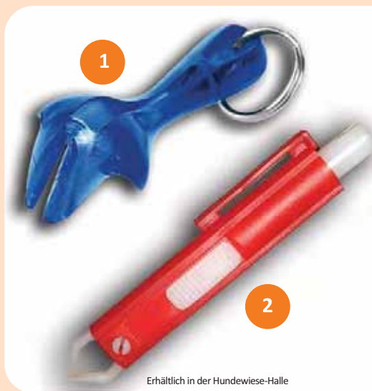
Erhältlich in der Hundewiese-Halle

Zur Entfernung bietet der Fachhandel viele – mehr oder weniger sinnvolle – Möglichkeiten an: Zeckenzangen, Pinzetten, Zeckenhaken ... Egal wofür sie sich entscheiden – die Technik ist wichtig. Setzen sie z.B. die Zeckenzange möglichst tief an der Haut an und drehen sie die Zeckenzange so lange, bis die Zecke von der Haut gelöst ist. Durch ein zu rasches Ziehen könnte der Kopf der Zecke abreißen und evtl. infizierter Speichel tritt aus. Benutzen sie nicht die Finger! Auch wenn die Zecke schon groß ist, könnte durch ein Quetschen des Zeckenkörpers die erregerehaltige Flüssigkeit in die Stichstelle gelangen.