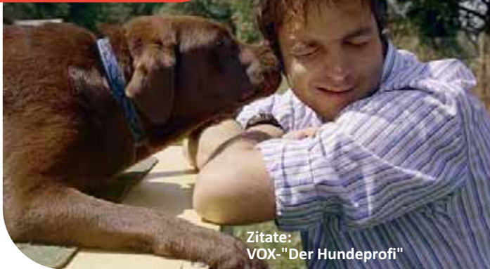
Zitate: VOX-"Der Hundeprofí"

Martin Rütter arbeitet nach seinem am Hund orientiertem System - dem D.O.G.S. : "dog orientated system". Schwerpunkt liegt dabei darauf, den Hund einschätzen zu lernen und die Bedürfnisse des Tieres zu entdecken. Die „Sprache“ der Hunde ist eine leise Sprache. Martin Rütter und seine D.O.G.S.-Coaches unterrichten die Menschen in dieser Sprache und zeigen ihnen, wie man mit seinem vierbeinigen Gefährten eindeutig kommunizieren und zu einem harmonischen Team werden kann. Mit den Mitteln der Tierpsychologie wird das Verhalten des Hundes positiv beeinflusst.