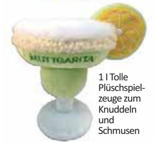
1 | Tolle Plüschspielzeuge zum Knuddeln und Schmusen