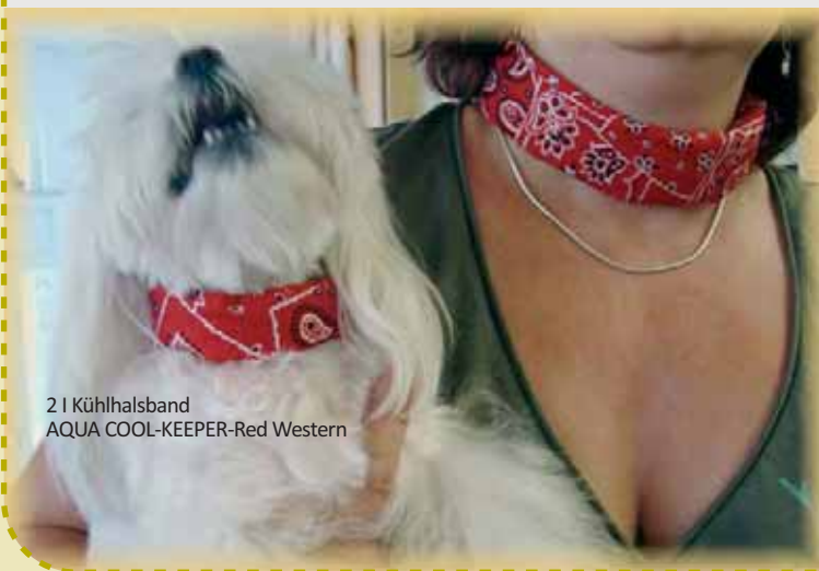
2 | Kühlhalsband AQUA COOL-KEEPER-Red Western