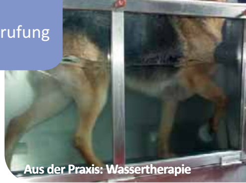
Aus der Praxis: Wassertherapie

Der Hauptschwerpunkt der Therapie ist die Schmerzlinderung. Weiterhin sind der Muskelaufbau, der Erhalt und das Wiedererlangen der Gelenkbeweglichkeit und das Bewusstmachen von Bewegung, Schwerpunkte der Therapie. Ebenso kann eine gute Vorarbeit für Operationen geleistet werden und auch zur Heilungsförderung und Rehabilitation ist die Krankengymnastik sehr gut einsetzbar. Der Hundephysio-